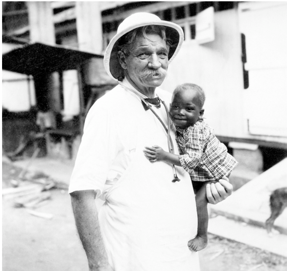
Albert Schweitzer, Tropenarzt und Träger des Friedensnobelpreises, in Lambarene (Gabon). Aufnahme aus den dreissiger Jahren.